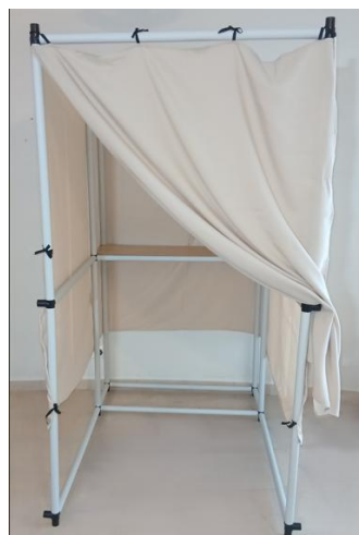
A kész szavazófülke

A függöny palástot hurkolással és kötéssel rögzítjük. Utoljára a bejárati függönyt helyezzük fel.