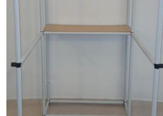
Az asztallap elhelyezése a középső vízszintes elemre.